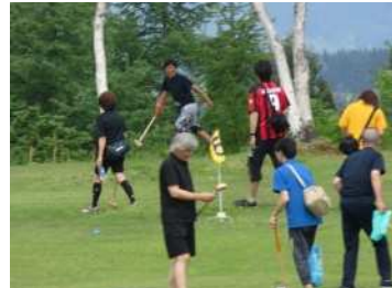
グラウンド・ゴルフ