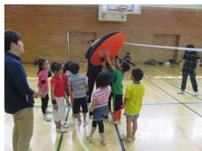
ヘルスバレーボール